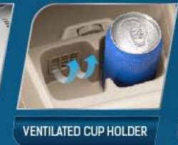
VENTILATED CUP HOLDER