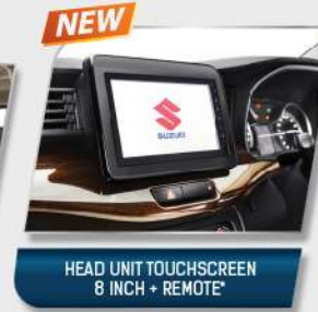
HEAD UNIT TOUCHSCREEN 8 INCH + REMOTE*