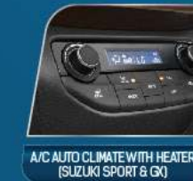
A/C AUTO CLIMATE WITH HEATER (SUZUKI SPORT & GX)