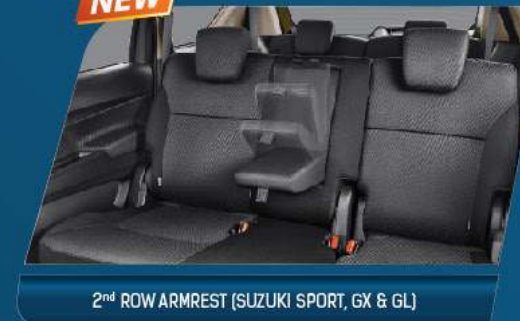
2 nd ROW ARMREST (SUZUKI SPORT, GX & GL)