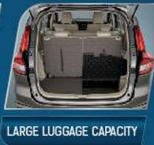
LARGE LUGGAGE CAPACITY