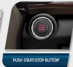
PUSH START/STOP BUTTON*