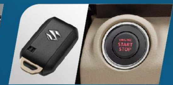
PUSH START/STOP BUTTON & REMOTE (SUZUKI SPORT & GX)