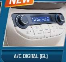
A/C DIGITAL (GL)