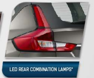
LED REAR COMBINATION LAMPS*