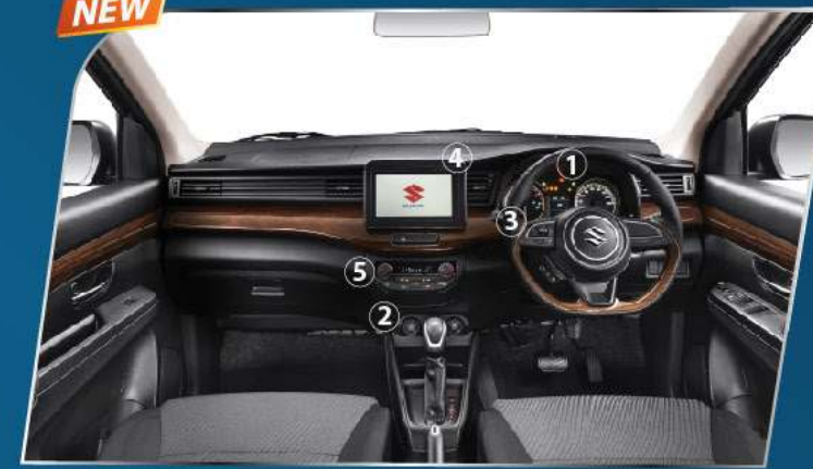
LUXURIOUS INSTRUMENT PANEL + DASHBOARD WITH WOODEN PATTERN & BLACK INTERIOR COLOR (SUZUKI SPORT & GX)