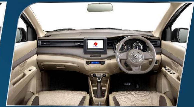
ELEGANT DASHBOARD + INSTRUMENT PANEL WITH BEIGE INTERIOR COLOR (GL & GA)