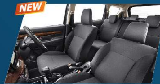
BLACK INTERIOR & SPACIOUS CABIN (SUZUKI SPORT & GX)