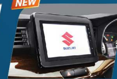
HEAD UNIT TOUCHSCREEN 8 INCH + REMOTE (SUZUKI SPORT & GX)