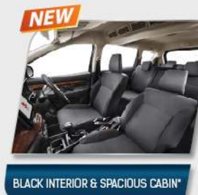
BLACK INTERIOR & SPACIOUS CABIN*

Scan untuk informasi lengkap atau kunjungi https://www.suzuki.co.id/automobile/all-new-ertiga